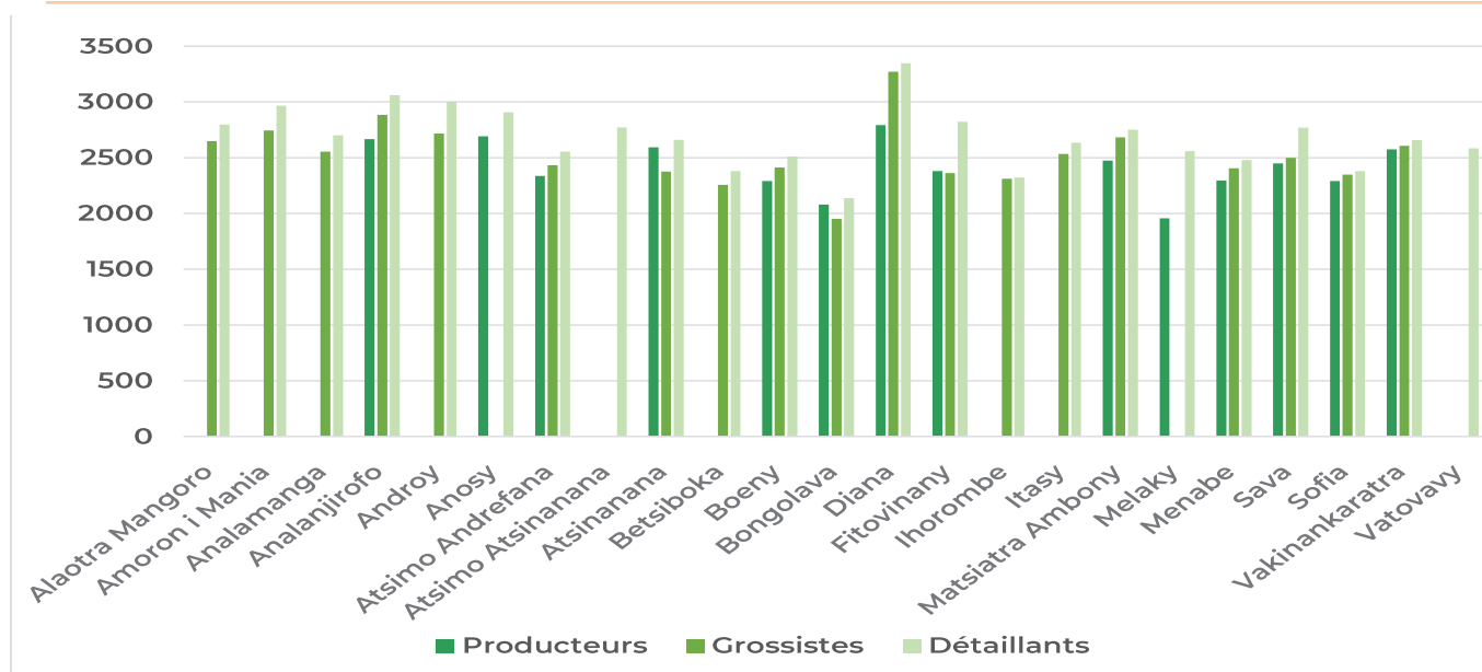
GRAPHE 1 : PRIX MOYENS DU RIZ BLANC LOCAL PAR RÉGION (EN ARIARY)